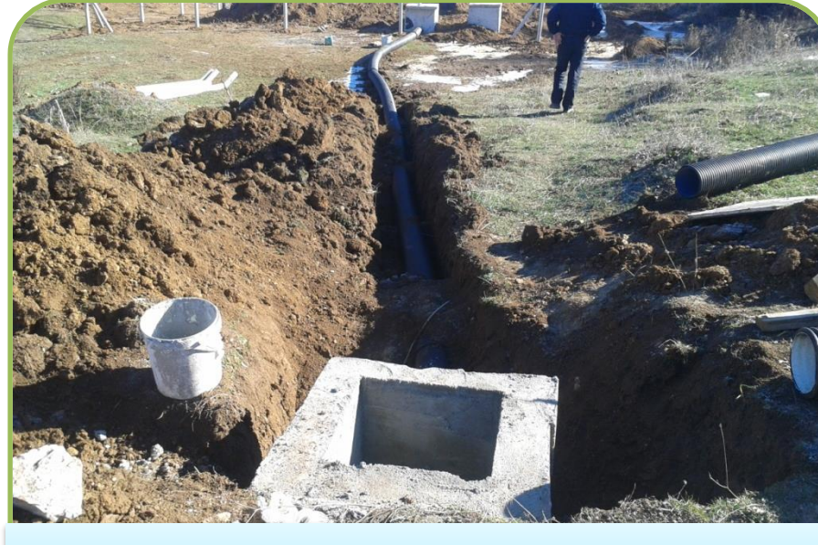
PAZARYERİ GÜMÜŞDERE FOSSEPTİK (Bitti)