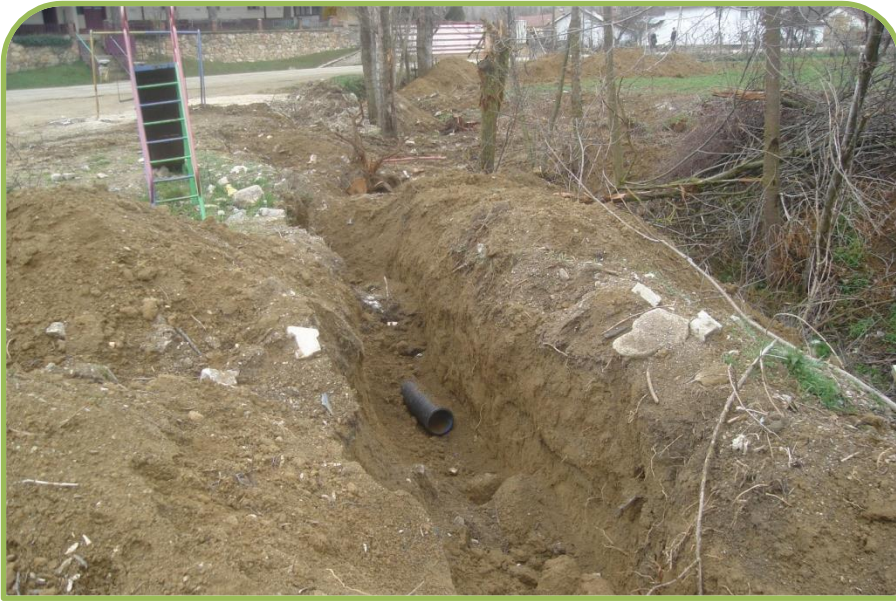
SÖĞÜT-OLUKLU KANALİZASYON (Bitti)