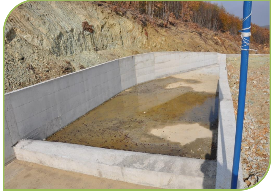
MERKEZ BAHÇECİK SULAMA GÖLETİNDEN GÖRÜNTÜLER