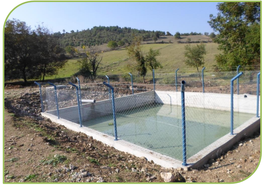
MERKEZ GÜLÜMBE SULAMA TESİSİNDEN GÖRÜNTÜLER