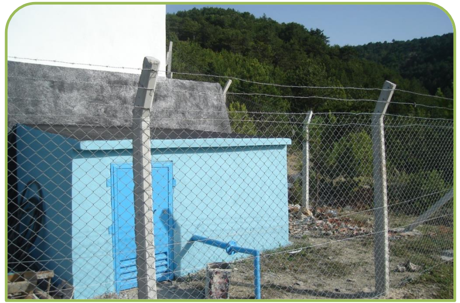
GÖLPAZARI-GÖZAÇANLAR DEPO ONARIMI (Bitti)