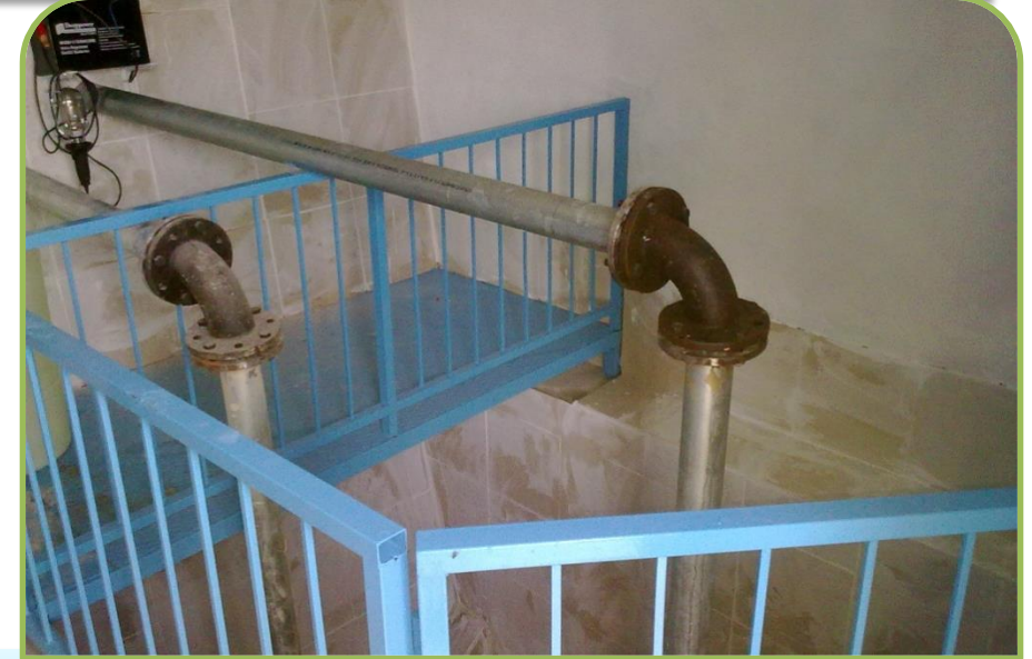
GÖLPAZARI-GÖKÇEÖZÜ DEPO ONARIMI (Bitti)