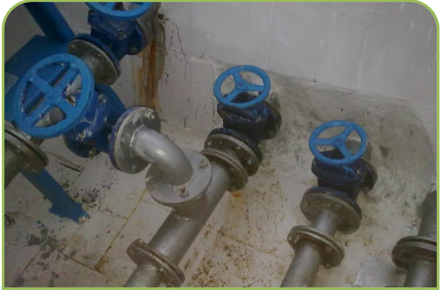
OSMANELİ – SELÇİK DEPO ONARIMI (Bitti)