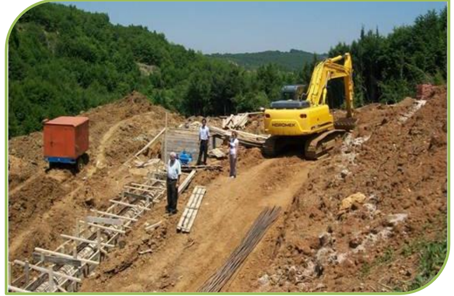
MERKEZ BAHÇECİK SULAMA GÖLETİNDEN GÖRÜNTÜLER