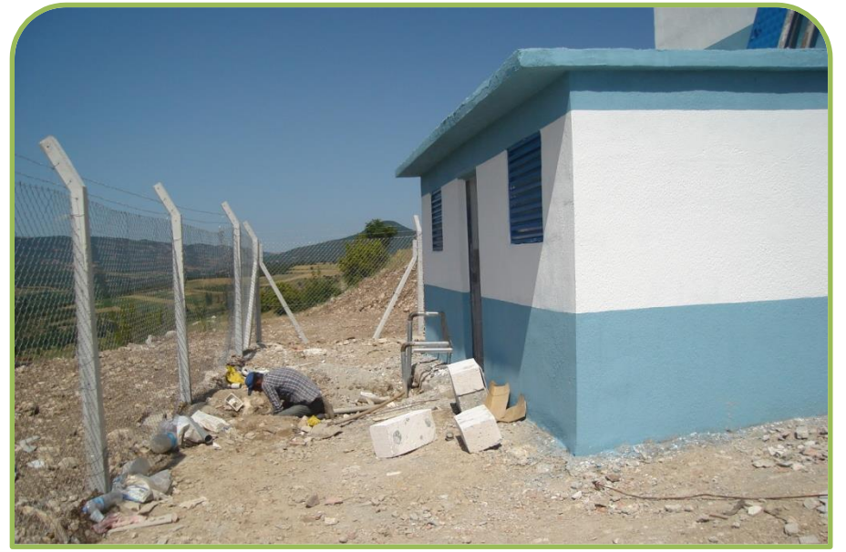
GÖLPAZARI-ARICAKLAR DEPO ONARIMI (Bitti)