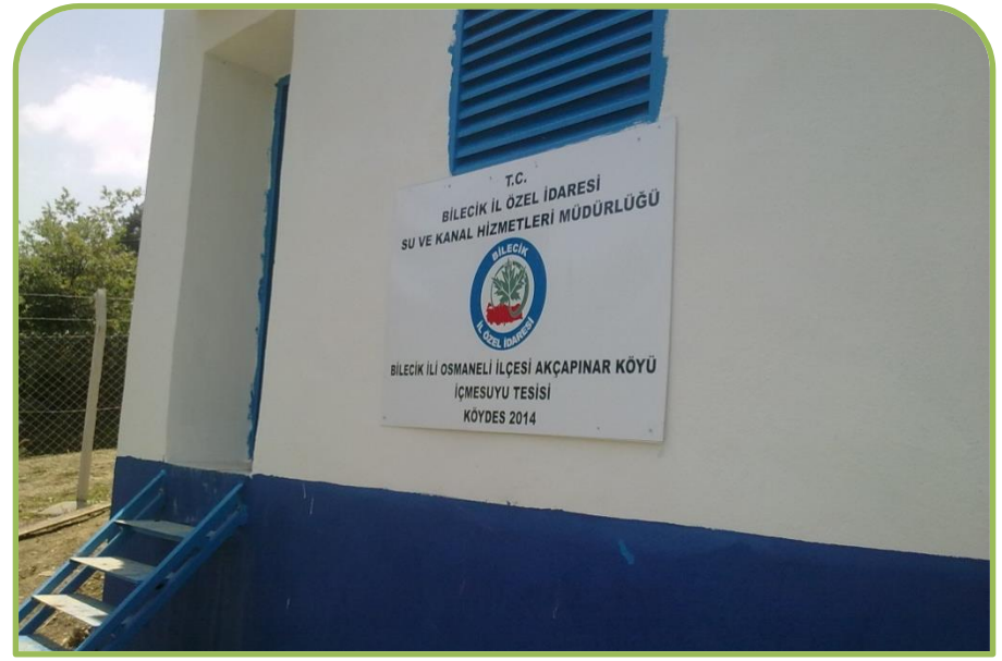
OSMANELİ AKÇAPINAR-GAZİLER MAH. DEPO ONARIMI (Bitti)