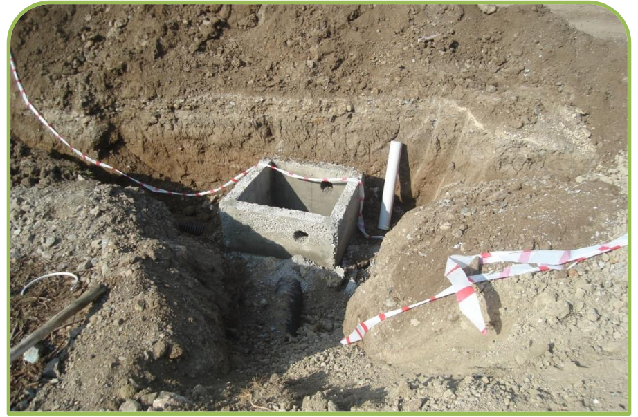
BOZÜYÜK-ECEKÖY KANALİZASYON (Bitti)