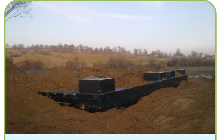
PAZARYERİ GÜMÜŞDERE FOSSEPTİK (Bitti)