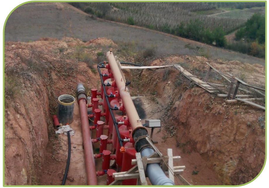
OSMANELİ DÜZMEŞE SULAMA TESİSİNDEN GÖRÜNTÜLER