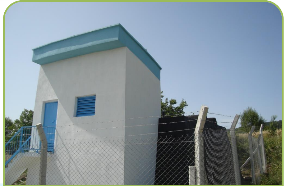
GÖLPAZARI-KÇ.SUSUZ DEPO ONARIMI (Bitti)