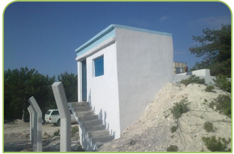
YENİPAZAR-ESENKÖY ARITMA ve DEPO ONARIMI (Bitti)