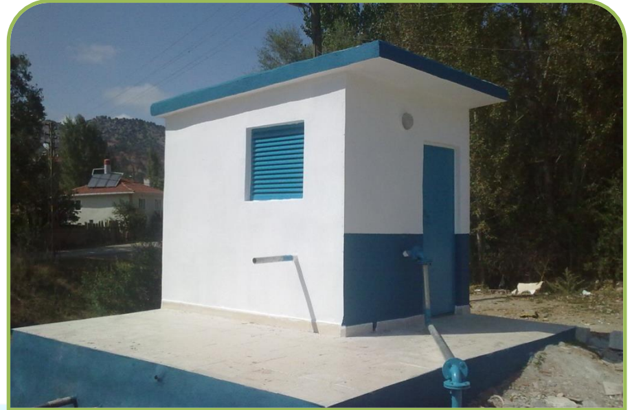
YENİPAZAR-YUKARIBOĞAZ DEPO ONARIMI (Bitti)